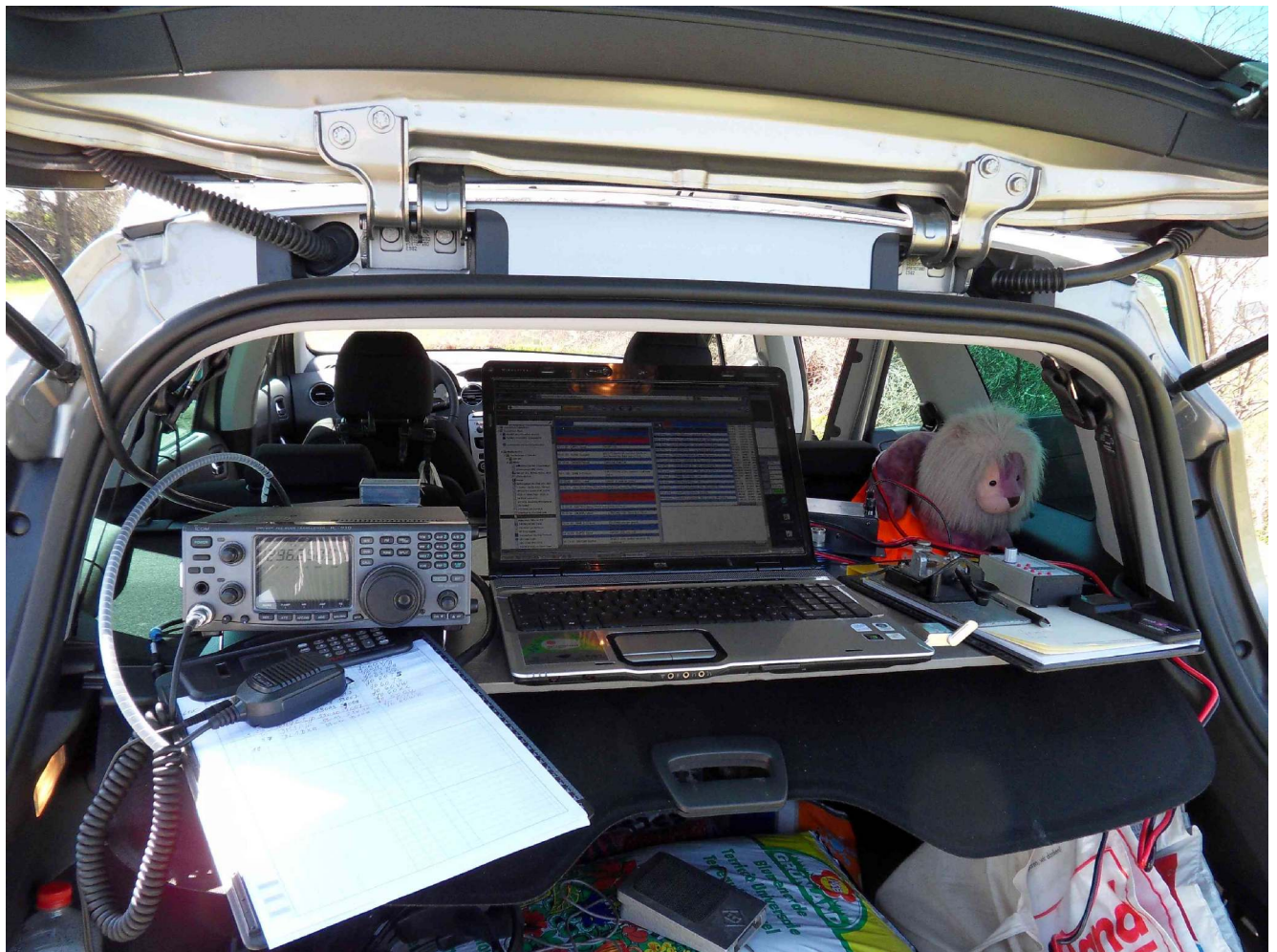
DJ7AL: Station mit Maskottchen