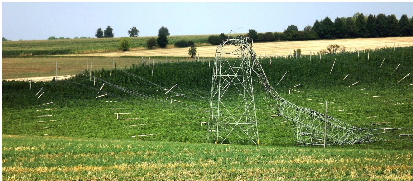
Tornado in JO51uc (Schkölen) am 14.08.15

Nächster DUR-Wettbewerb am 20. September : 08 00 - 11 00 UTC !!!EXTRA 6cm-Aktivität, alle QSOs auf 5,7GHz mit doppelten Faktor!!!