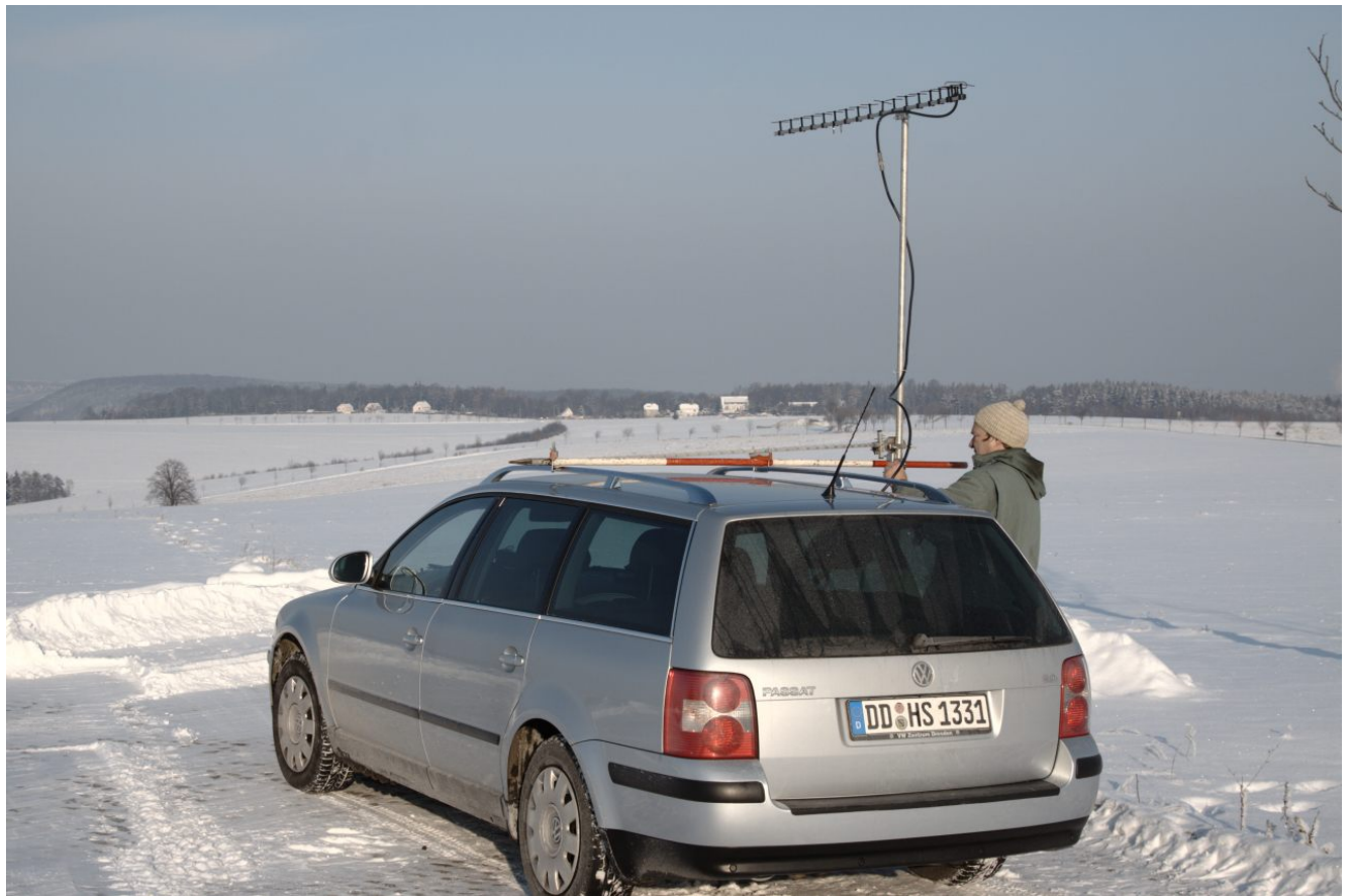
DG2DWL, JO60UX, qrv auf 23cm (tnx DH1DM)