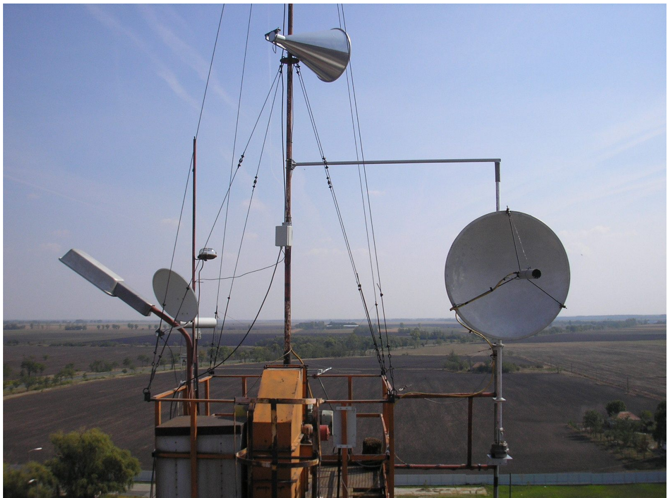
HA8MV – hier war es wesentlich wärmer...