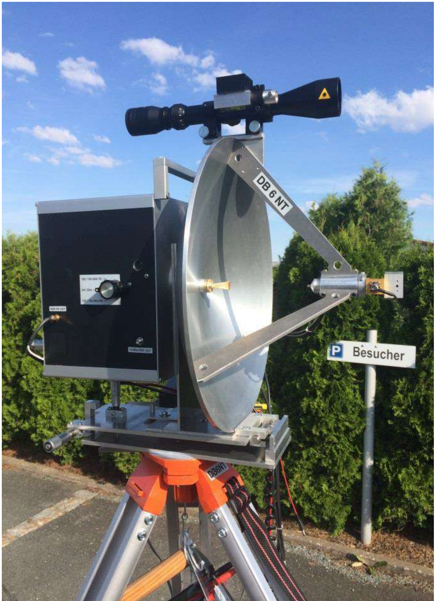
Erstverbindung im 725 GHz Amateurband zwischen DB6NT und DB2NP:

http://www.db6nt.de/fileadmin/userfiles/_pdf/download_archiv/Erstverbindung-im-725-GHz-Amateurband.pdf