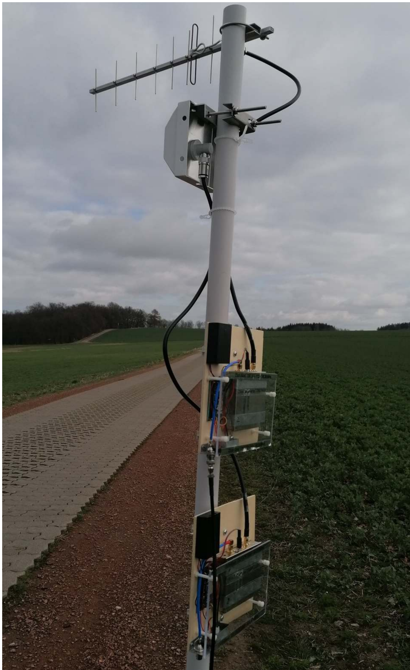
DM6JKC-Station in JO60KR